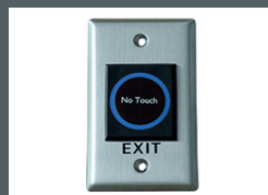
Botón de salida